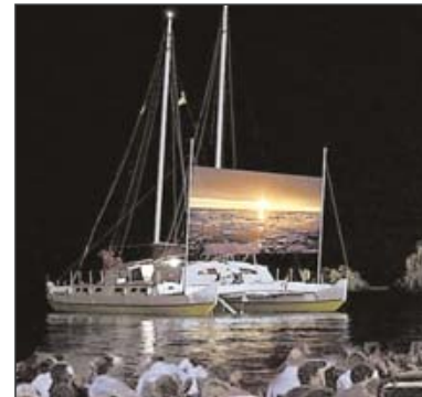
Groß genug fürs Open-Air-Kino: Selbst für filmische Botschaften im Strand-Kino taugt das Boot.