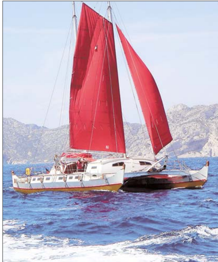
Stolzer Zweimaster: 20 Meter lang, zehn Meter breit – das ist die „Largyalo“. Sie bietet auf 70 Quadratmetern Wohnfläche auch Platz für Forschungsgruppen.

Allerdings nicht einfach nur so. Dafür hätte es ein anderes, ein kleineres, ein billigeres Boot als die 20 Meter lange „Largyalo“ auch getan: In der steckt Material im Einkaufswert von 300.000 Euro, Baukosten, Mieten für Werkzeuge, Maschinen, Hallen und Transporte für weitere 300.000 Euro – und 30.000 Arbeitsstunden. In sieben statt wie zunächst geplant drei Jahren, in denen Kellner und Wolfinger ja auch von etwas le-